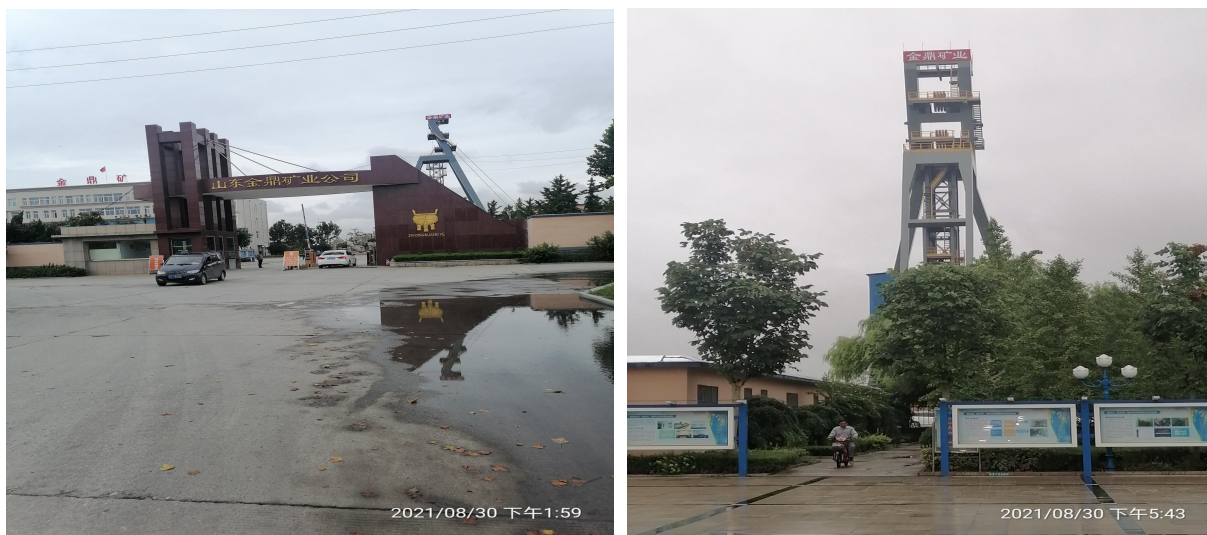
图 8-2 矿山开发现状